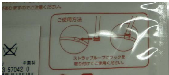
チェーンの絵がない